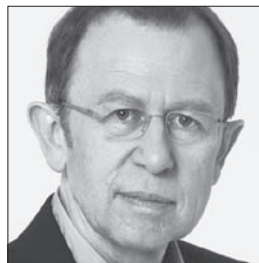
Viktor Giacobbo TV-Kabarettist EXIT-Mitglied seit 2008