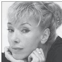
Sibylle Berg Schriftstellerin EXIT-Mitglied seit 2006