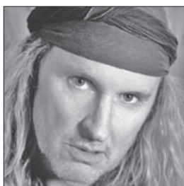
Chris von Rohr Musiker und Produzent EXIT-Mitglied seit 2012